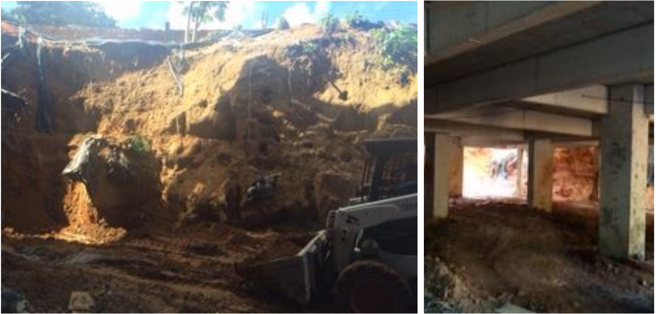
Foto 6: Limpeza mecanizada da parte externa e acesso da obra com descarte de material