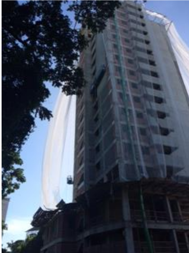
Foto1: Substituição da tela de fachada.